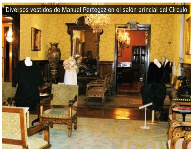
Diversos vestidos de Manuel Pertegaz en el salón principal del Círculo