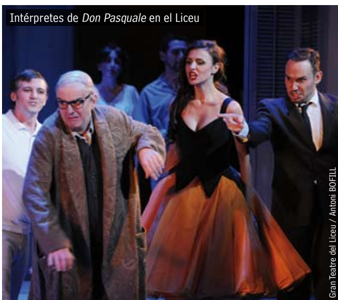
Intérpretes de Don Pasquale en el Liceu

El internacionalmente reconocido oncólogo José Baselga , director médico del Memorial Sloan Kettering Cancer Center, y recientemente elegido como presidente de la Asociación Americana para la Investigación del Cáncer (AACR), fue el protagonista del Dinar-Cercle del pasado 11 de mayo. El especialista impartió un coloquio para los socios en el que, bajo el título Tratamiento de precisión contra el cáncer , desgranó los avances científicos en la lucha contra esta enfermedad. Entre las investigaciones en las que trabaja el doctor Baselga se encuentra el análisis del genoma, la inmunoterapia o la realización de biopsias líquidas.