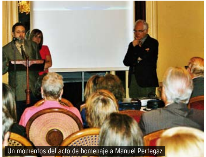
Un momentos del acto de homenaje a Manuel Pertegaz

Al finalizar el documental, y una vez los asistentes habían visitado la exposición de vestidos en el salón principal del club, se pudo disfrutar de un cóctel en la terraza del Círculo con sushi del Grupo Nomo y gin-tonics de la firma Hendrick's.