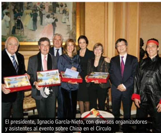
El presidente, Ignacio García-Nieto, con diversos organizadores y asistentes al evento sobre China en el Círculo