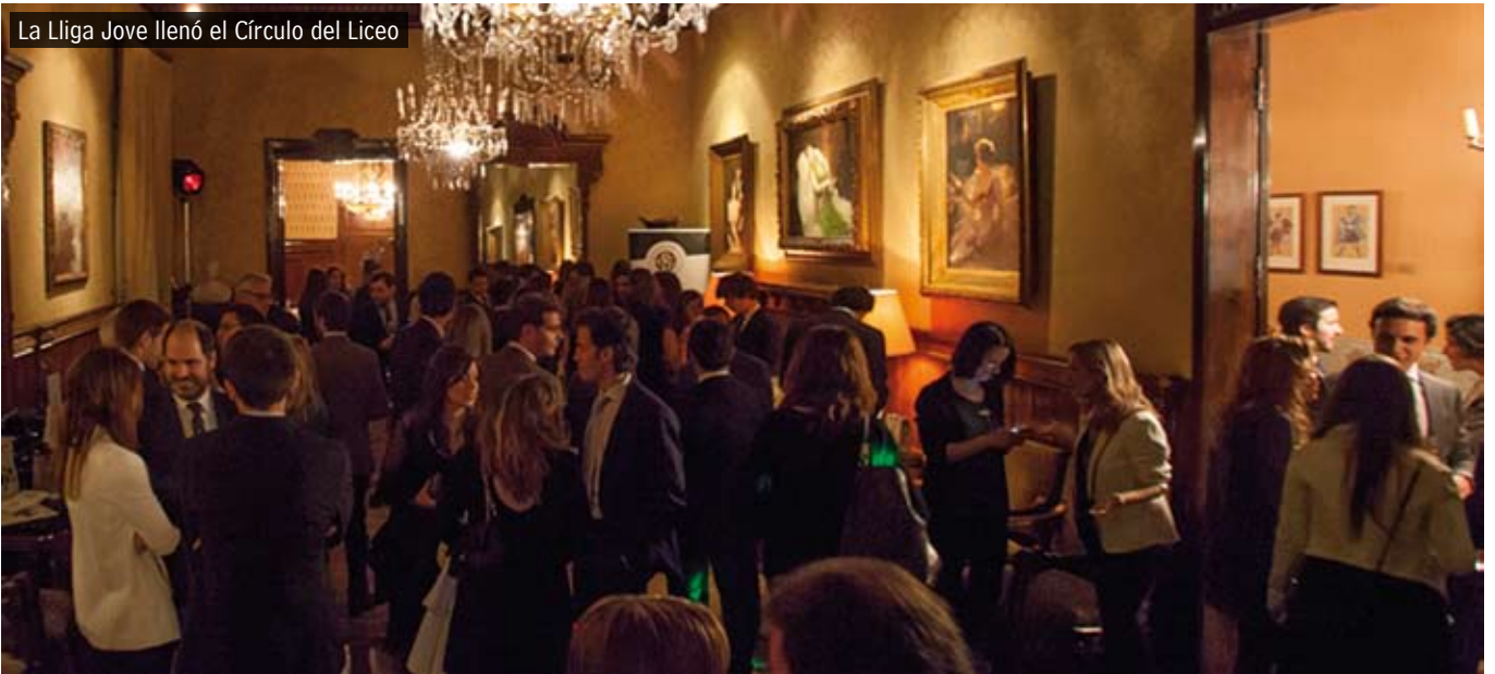
La Liga Jove llenó el Círculo del Liceo