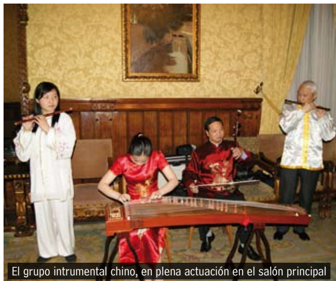
El grupo intrumental chino, en plena actuación en el salón principal