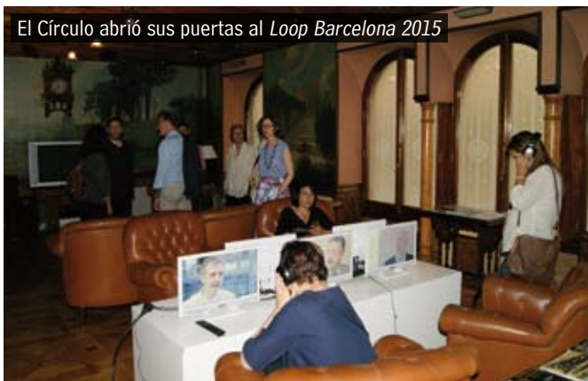
El Círculo abrió sus puertas al Loop Barcelona 2015