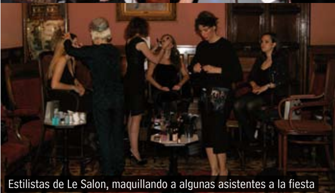
Estilistas de Le Salon, maquillando a algunas asistentes a la fiesta