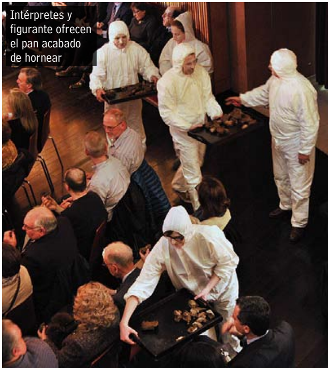
Intérpretes y figurante ofrecen el pan acabado de hornear