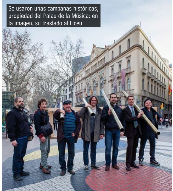
Se usaron unas campanas históricas, propiedad del Palau de la Música: en la imagen, su traslado al Liceu