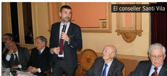
El conseller Santi Vila