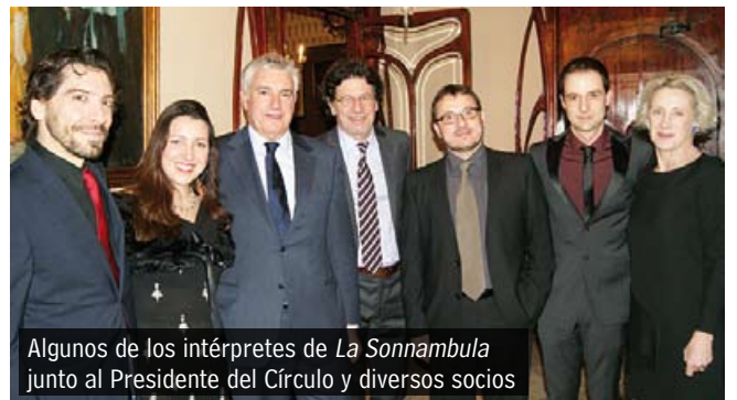
Algunos de los intérpretes de La Sonnambula junto al Presidente del Círculo y diversos socios