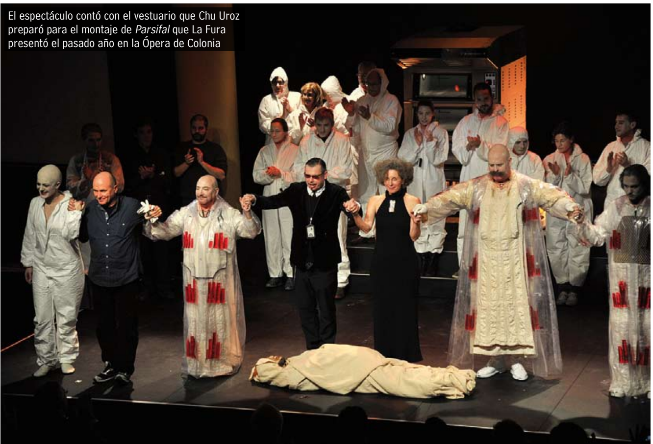
El espectáculo contó con el vestuario que Chu Uroz preparó para el montaje de Parsifal que La Fura presentó el pasado año en la Ópera de Colonia