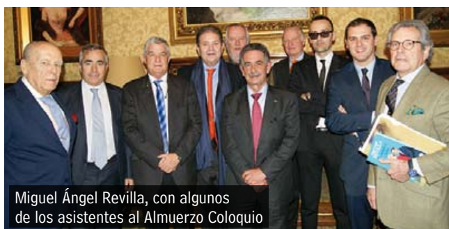
Miguel Ángel Revilla, con algunos de los asistentes al Almuerzo Coloquio