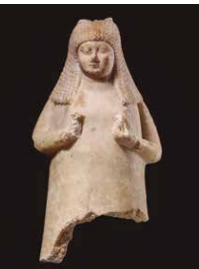
Vaso en forma de mujer Sippar (Irak) 700-600 a. C. Calcita

Las voces de los protagonistas y de los cronistas de la época describen lo que supuso el lujo en un momento de la historia en el que la riqueza y la opulencia podían definir el poder económico y político de estos antiguos imperios.