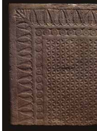
Umbral de puerta tallado Palacio norte, Nínive (Irak) 645-640 a. C. Piedra calcárea

El rey Asarhaddón erigió su palacio como una clara y manifiesta muestra de ostentación de riqueza y opulencia, muy propia de los asirios.