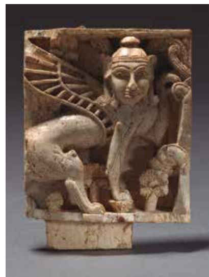
Placa decorativa Fortaleza de Salmanasar, Nimrud (Irak) 900-700 a. C. Marfil