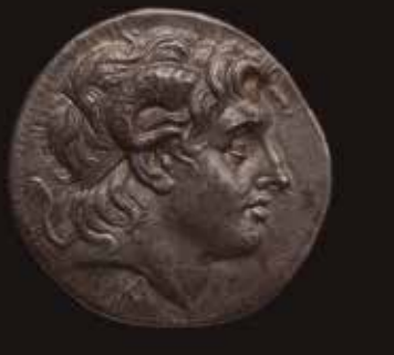
Moneda con imagen de Alejandro Magno Pérgamo (Turquía) 306-281 a. C. Plata

La entrada de Alejandro en la ciudad de Damasco muestra cómo era el saqueo de la época, pero también lo que representaba el lujo, y la admiración que los griegos sentían por la exquisitez de la realeza aqueménida y por Darío, que había conseguido huir del ejército de Alejandro dejando atrás todas las posesiones de su imperio.