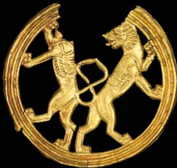
Detalle de una placa de oro, accesorio para ornamento en la ropa. Irán, 600-400 a. C.